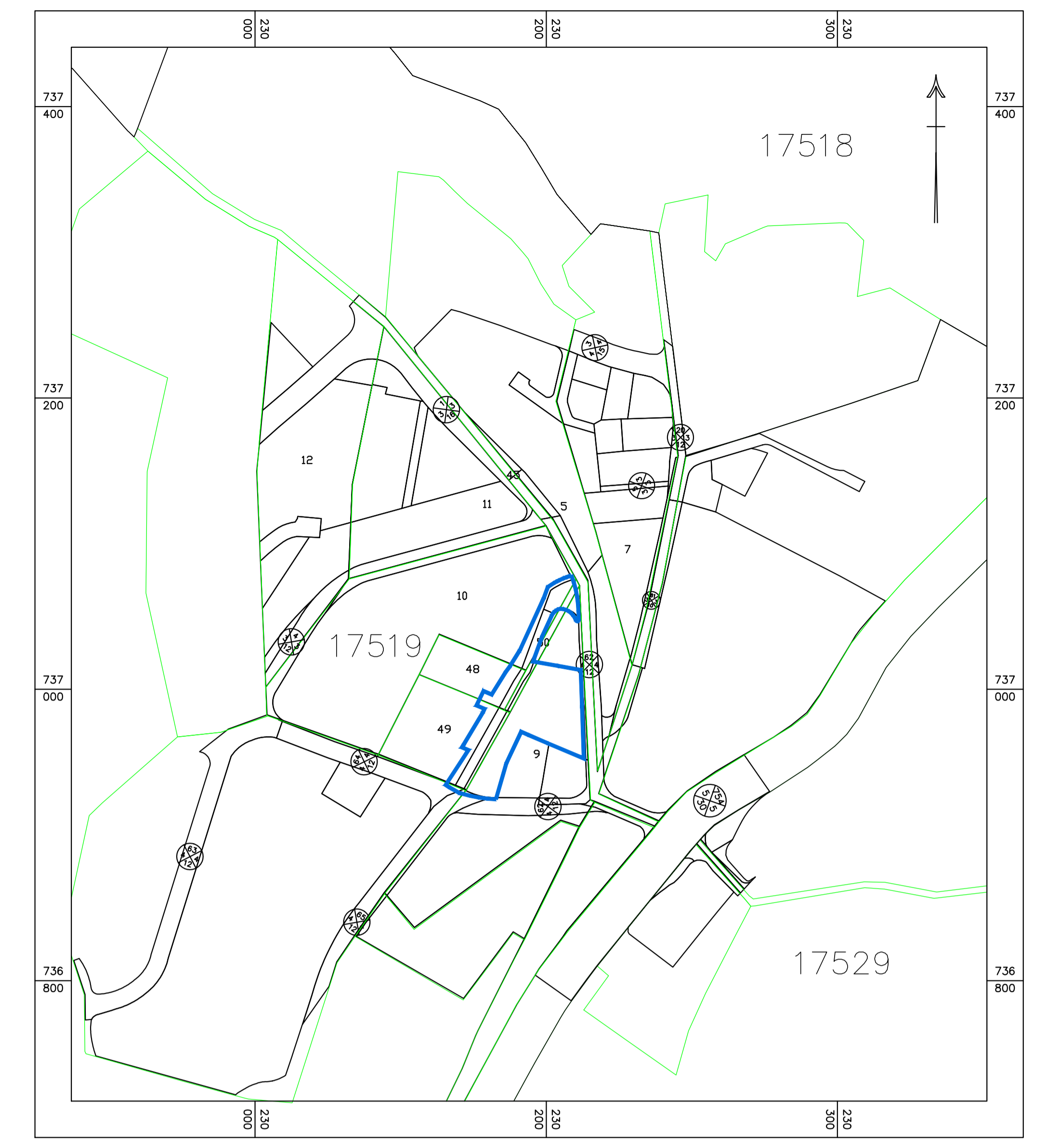
תרשים סביבה 1:2500