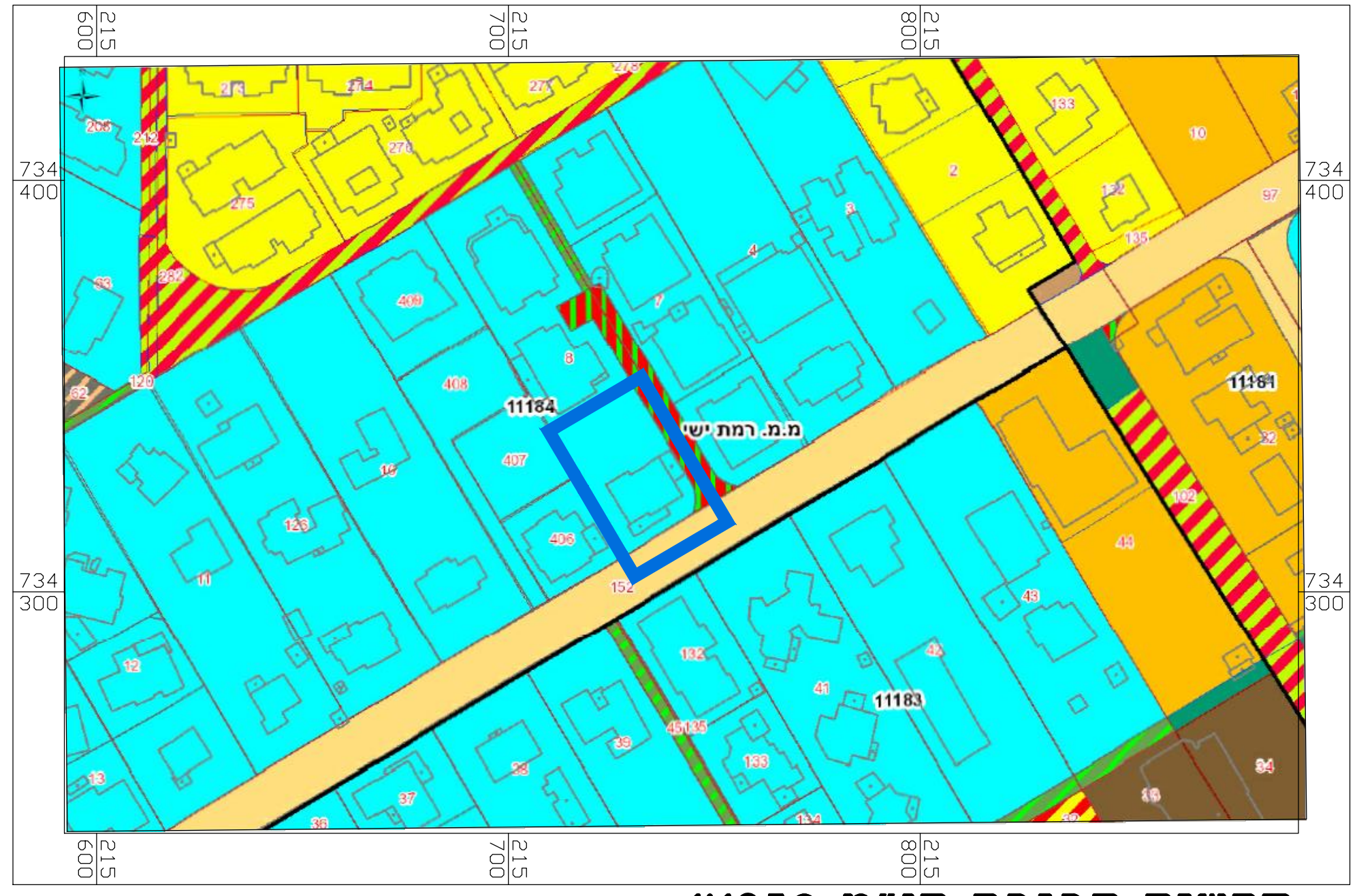
תרשים סביבה קנ"מ 1:1250

חוק התכנון והבנייה, התשכ"ה - 1965 תכנית מפורטת