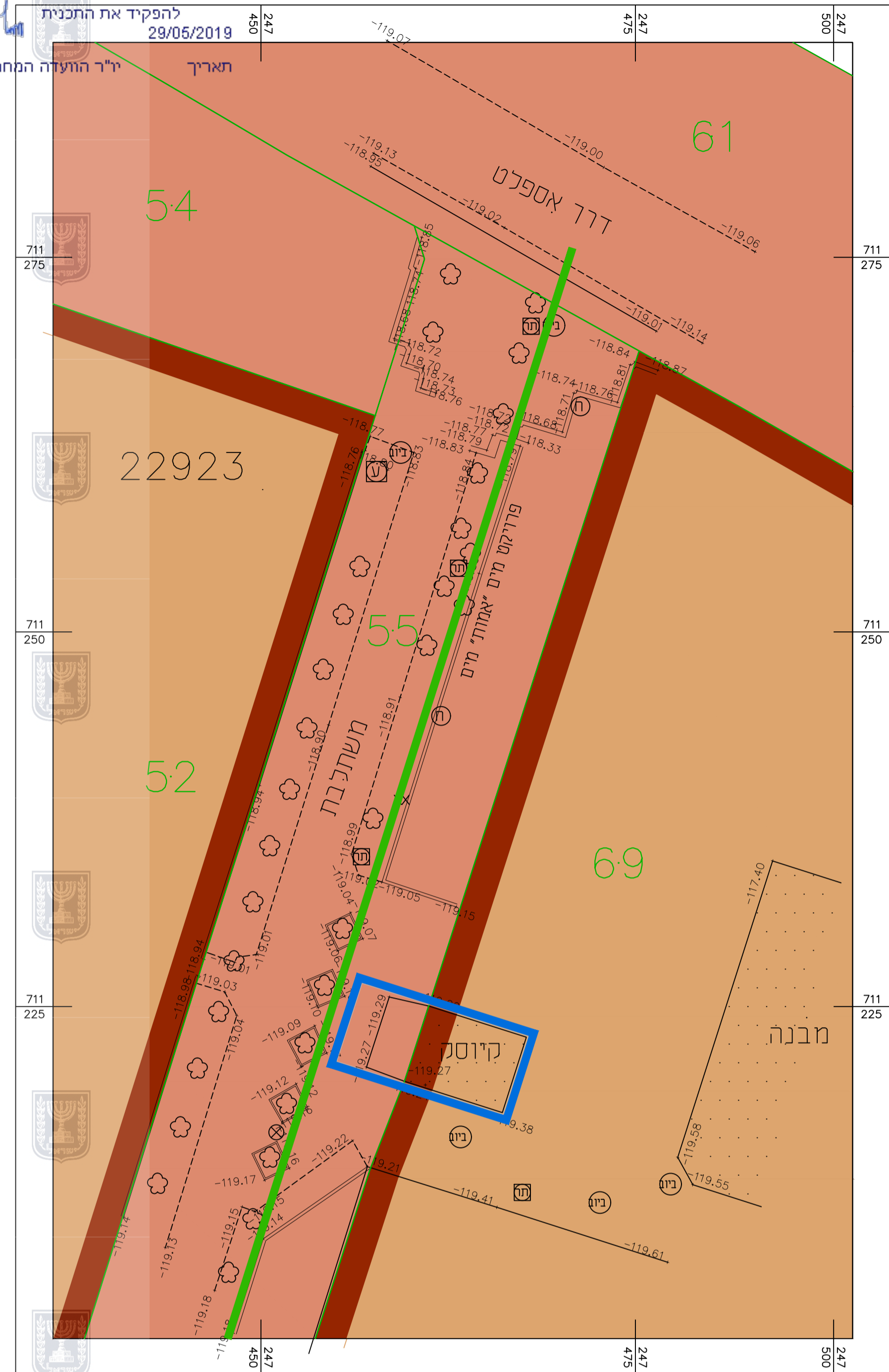
תשריט מצב מאושר קנ"מ 1:250