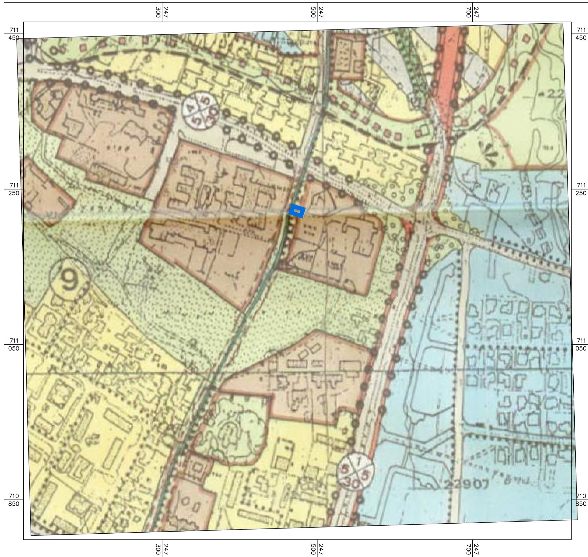
תרשים סביבה קנ"מ 1:2500 עפ"י תכנית מס' ג' 6995

חוק התכנון והבנייה, התשכ"ה - 1965 תכנית מתאר מקומית