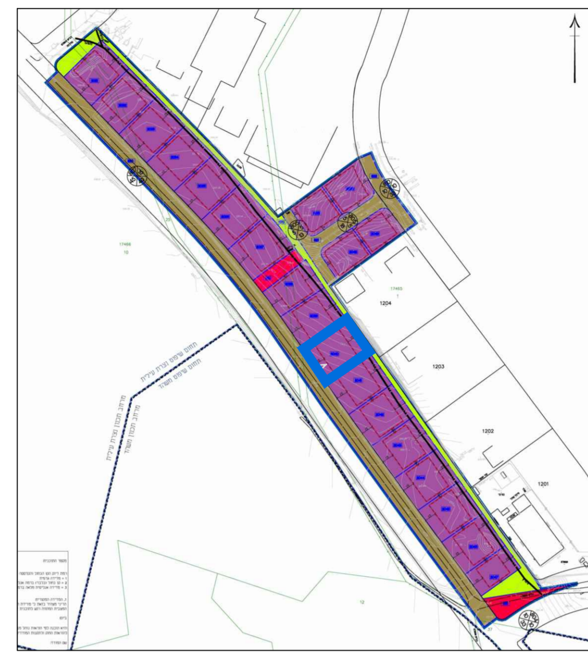
תרשים סביבה לפי תוכנית ג/20309 1 : 2500