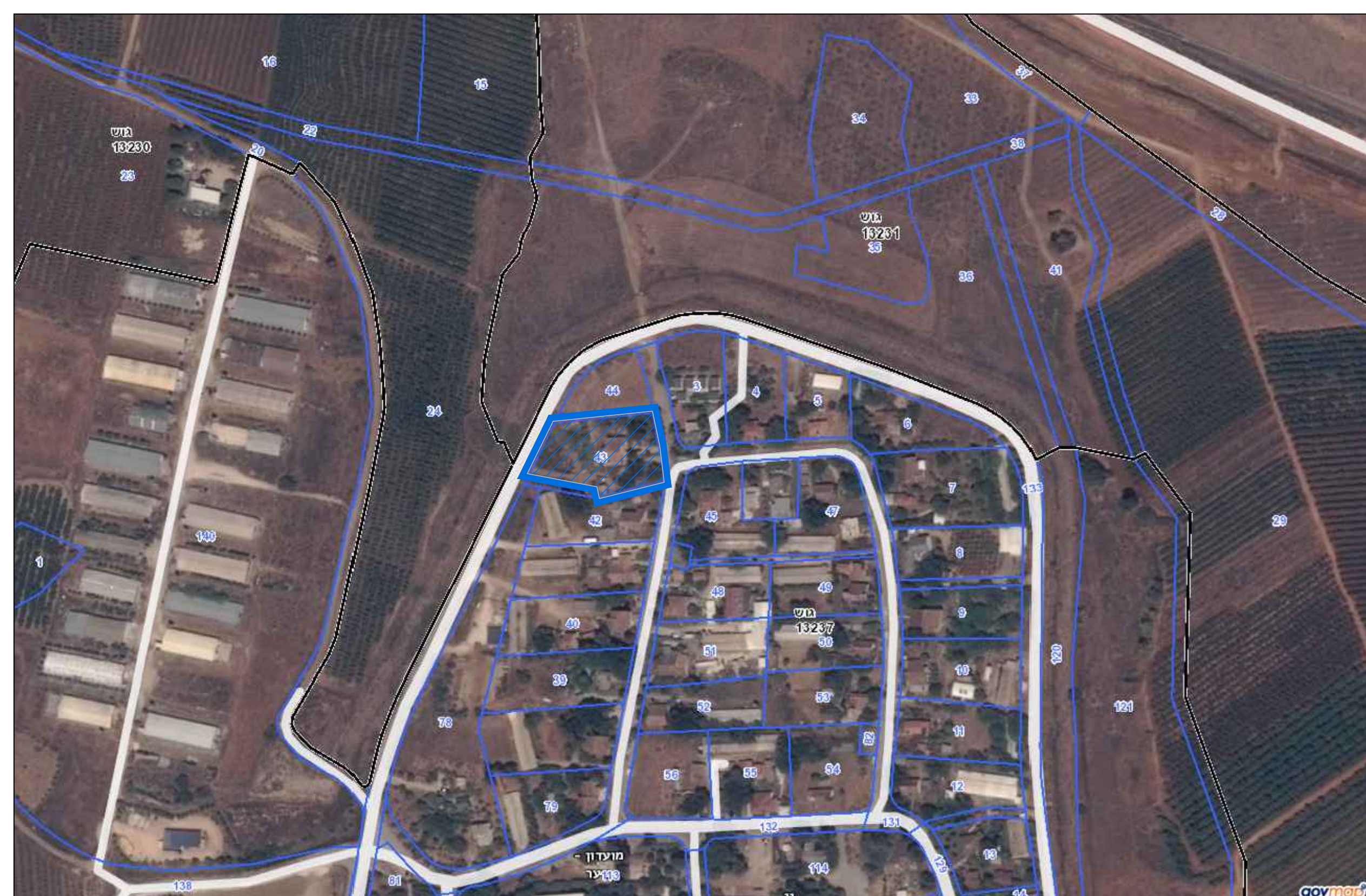
תצ"א קנ"מ 1:2500