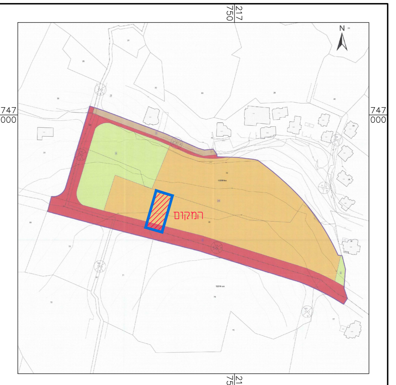
תרשים סביבה לפי ג' 21817 קו"מ 1:2,500