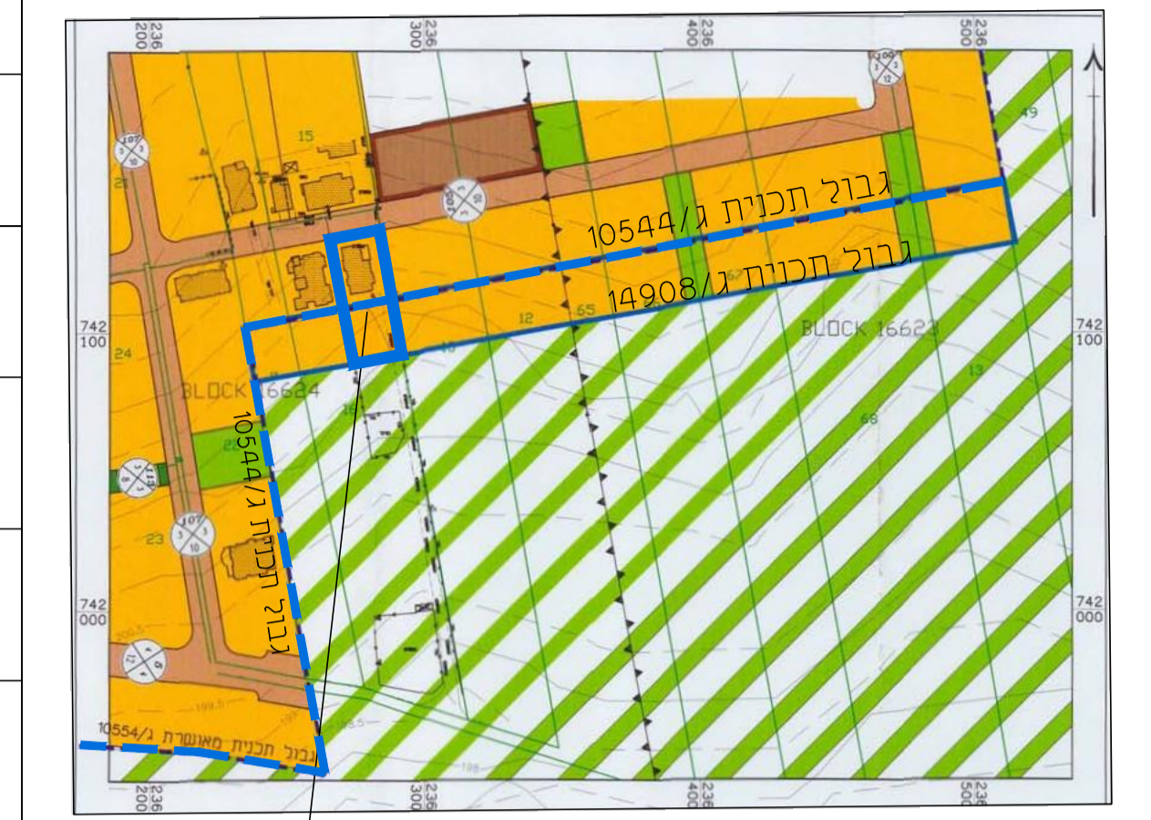
תרשים סביבה-קנ"מ 1:2500- על רקע תכנית ג/14908