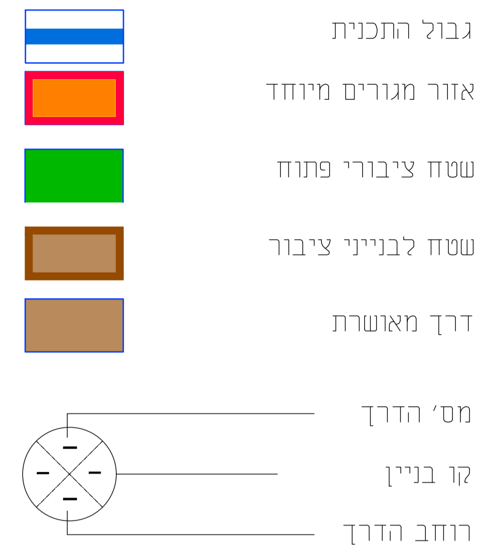
תרשים סביבה עפ"י ג/6569