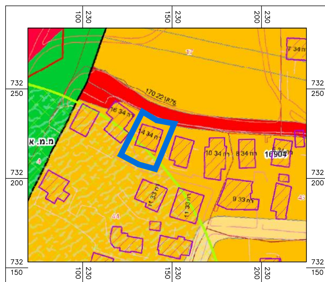
תרשים סביבה קנ"מ 1:1250

חוק התכנון והבנייה, התשכ"ה - 1965 תכנית מתאר מקומית