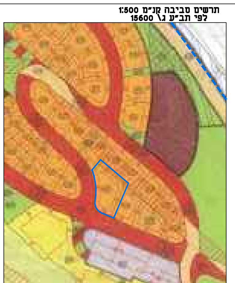
תרשים סביבה קני"מ 1:500 לפי תב"ע נ" 15600