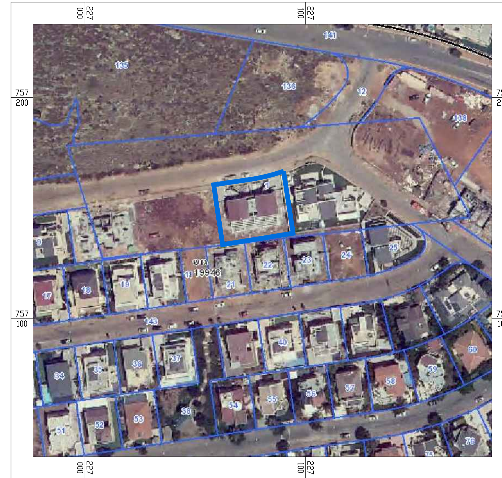
תרשים התמצאות קנ"מ 1:1000