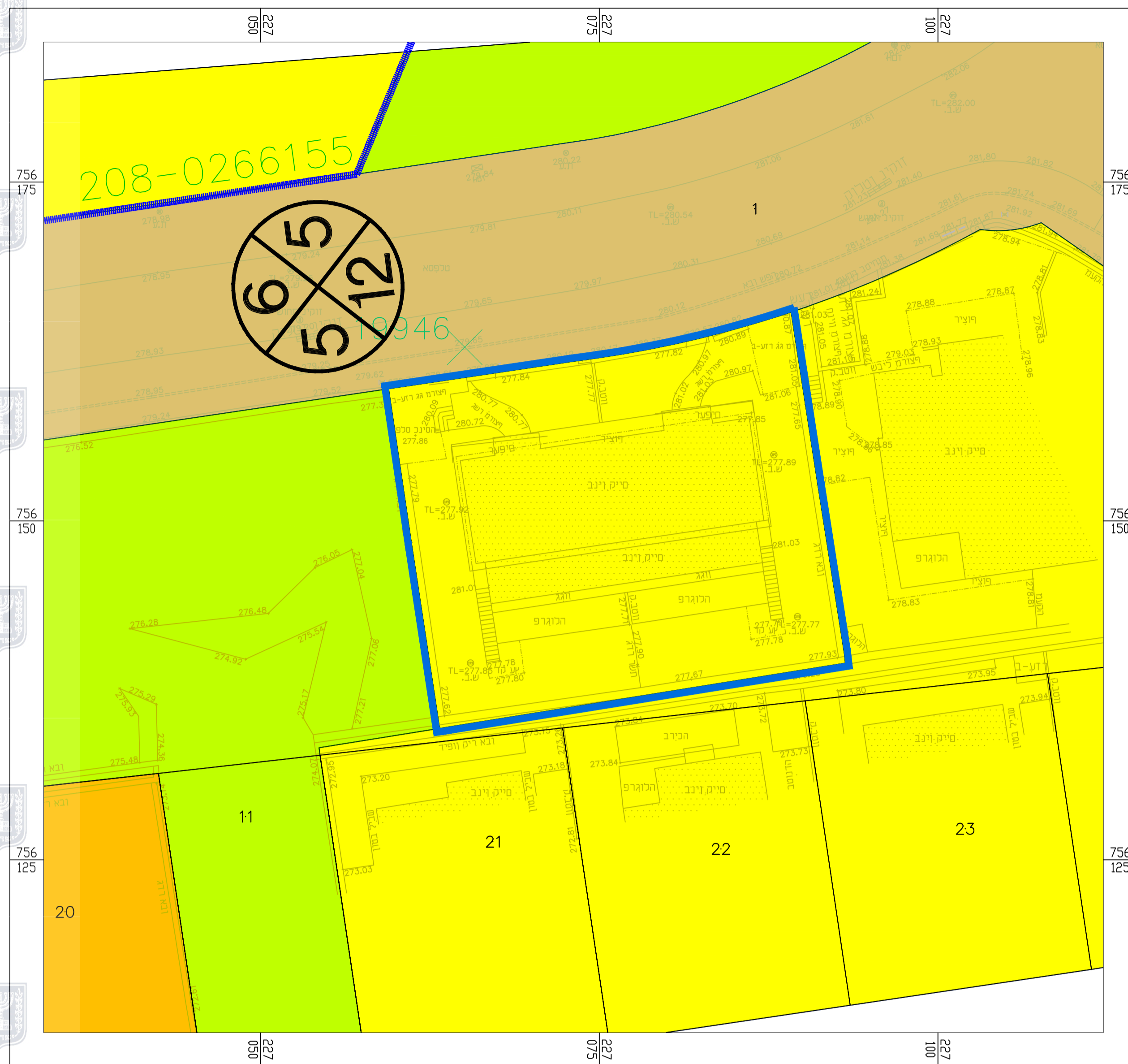
תכנית מאושרת קנ"מ 1:250

רוזטה מס' כביש — 000 קו בניין — 5 רוחב — 00