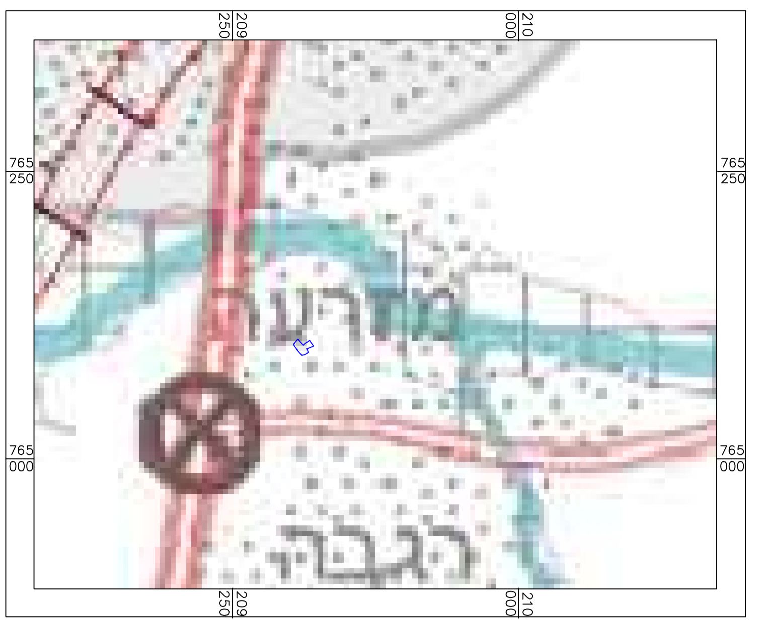
תימא 1:10000 קני"מ