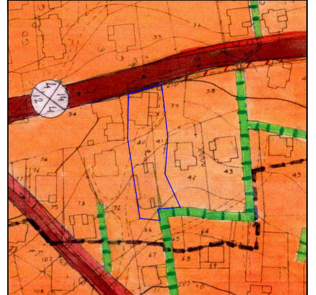
תרשים סביבה קמ/גמ/8584/316 1500

גבול תכנית קמ/גמ/8584/316 תרשים הסביבה ג/8584/1 : 1250