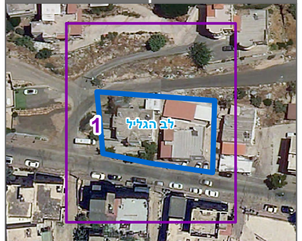
שנת צילום אוויר: 2019

הריני מצהיר בזאת כי המפה הטופוגרפית/המצבית המהווה רקע לתכנית זו, נערכה על ידי ביום 22/12/2020 והיא הוכנה לפי הוראות נוהל מבא"ת ובהתאם להוראות החוק ולתקנות המודדים שבתוקף. דיוק הקו הכחול והקדסטר: מדידה אנליטית מלאה ברמת תצ"ר עובדה עבד אלמג'יד שם המודד 1338 מספר רישיון תאריך חתימה