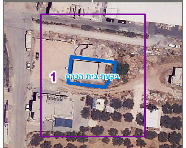
שנת צילום אוויר: 2019