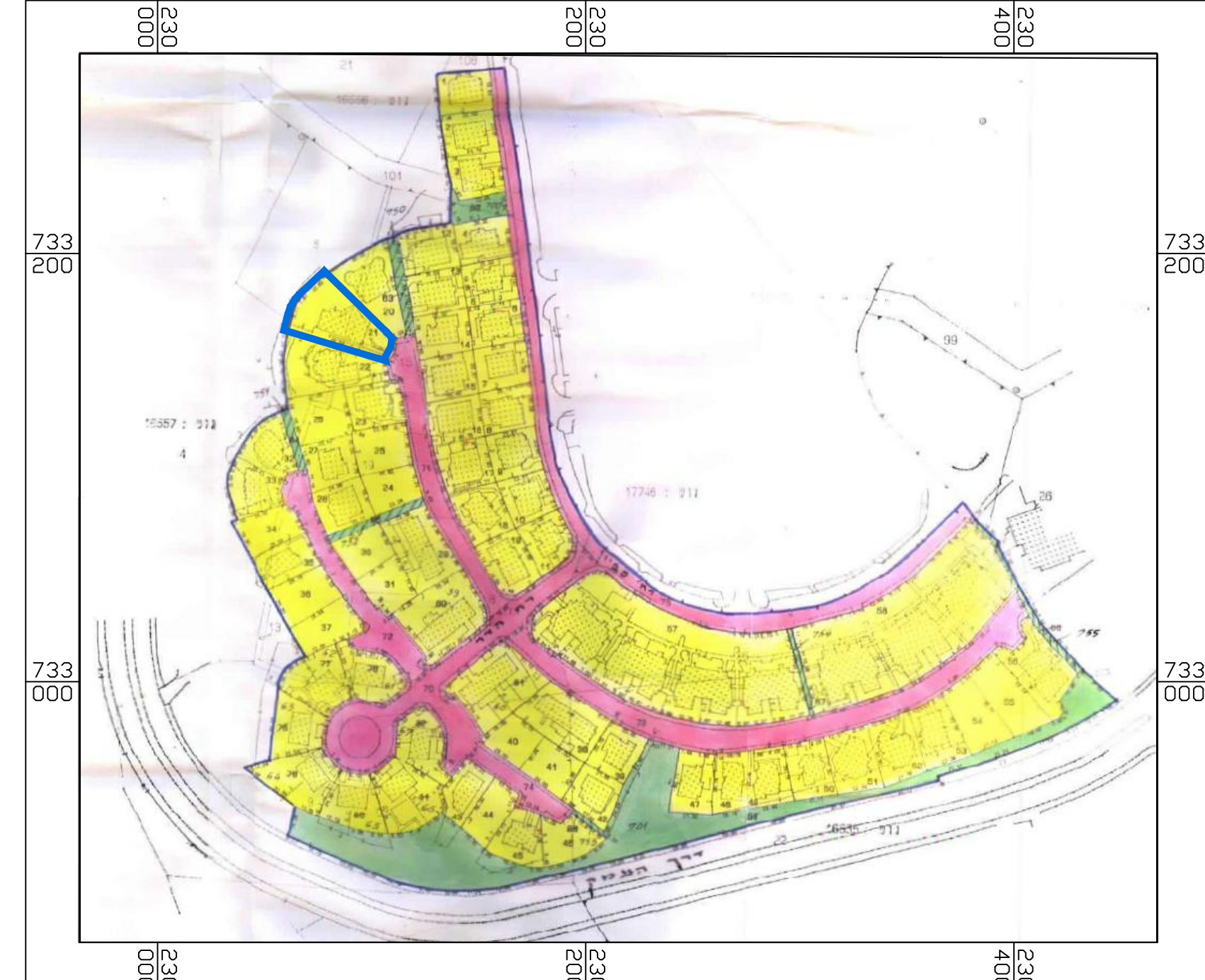
תרשים סביבה קנ"מ 1:2500 עפ"י תכנית מס' תרש"צ 102\26

חוק התכנון והבניה, התשכ"ה - 1965 תכנית מתאר מקומית