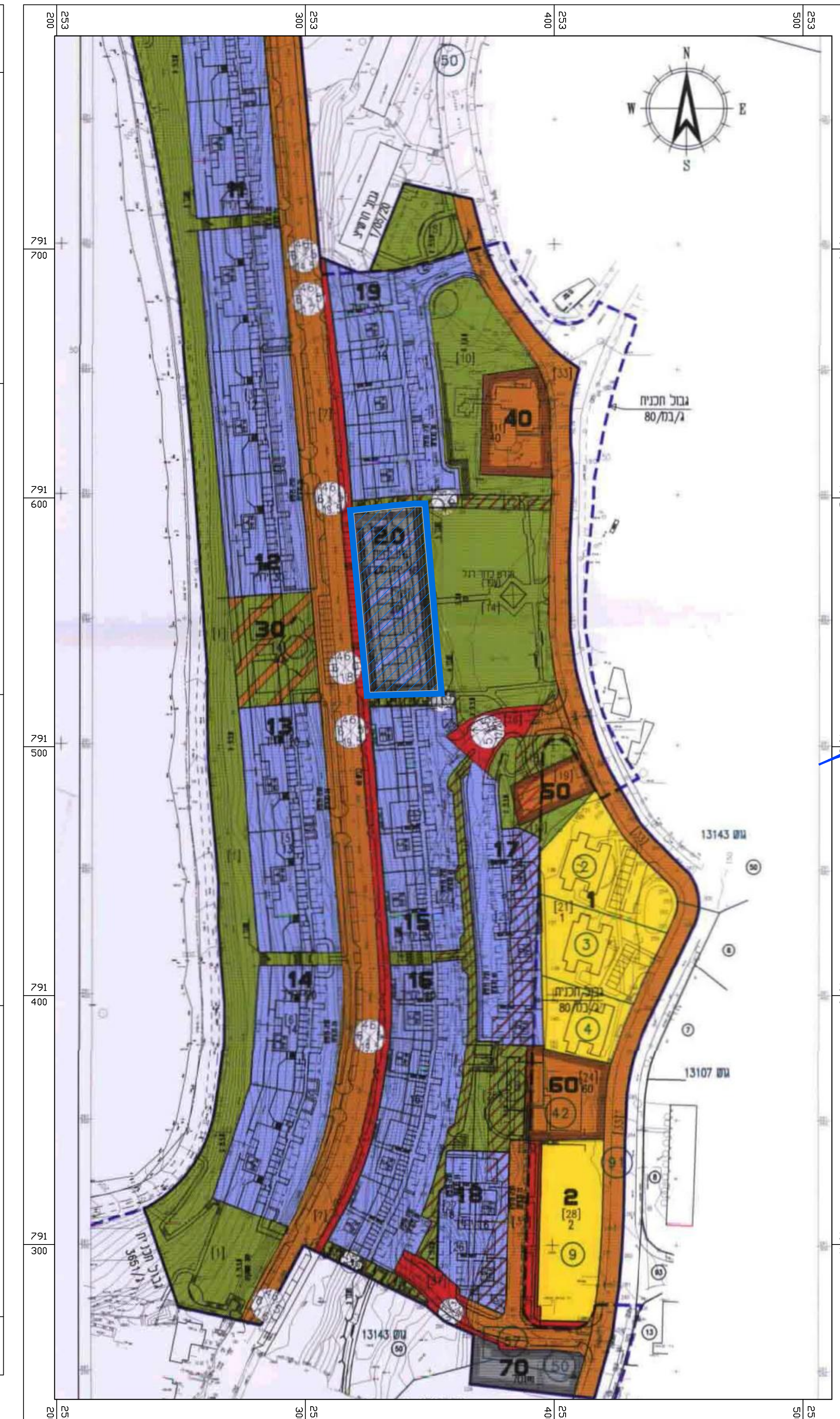
תרשים סביבה קני"מ 1:1250 לפי תכנית ג' 9948

שם תפקיד חתימה אדריכל בריק מאמנו תכנית אדריכל - בריק מאמנו בריק - תכנון אדריכלי ובינוי ערים רשומן מנהל שטח - בריק מאמנו