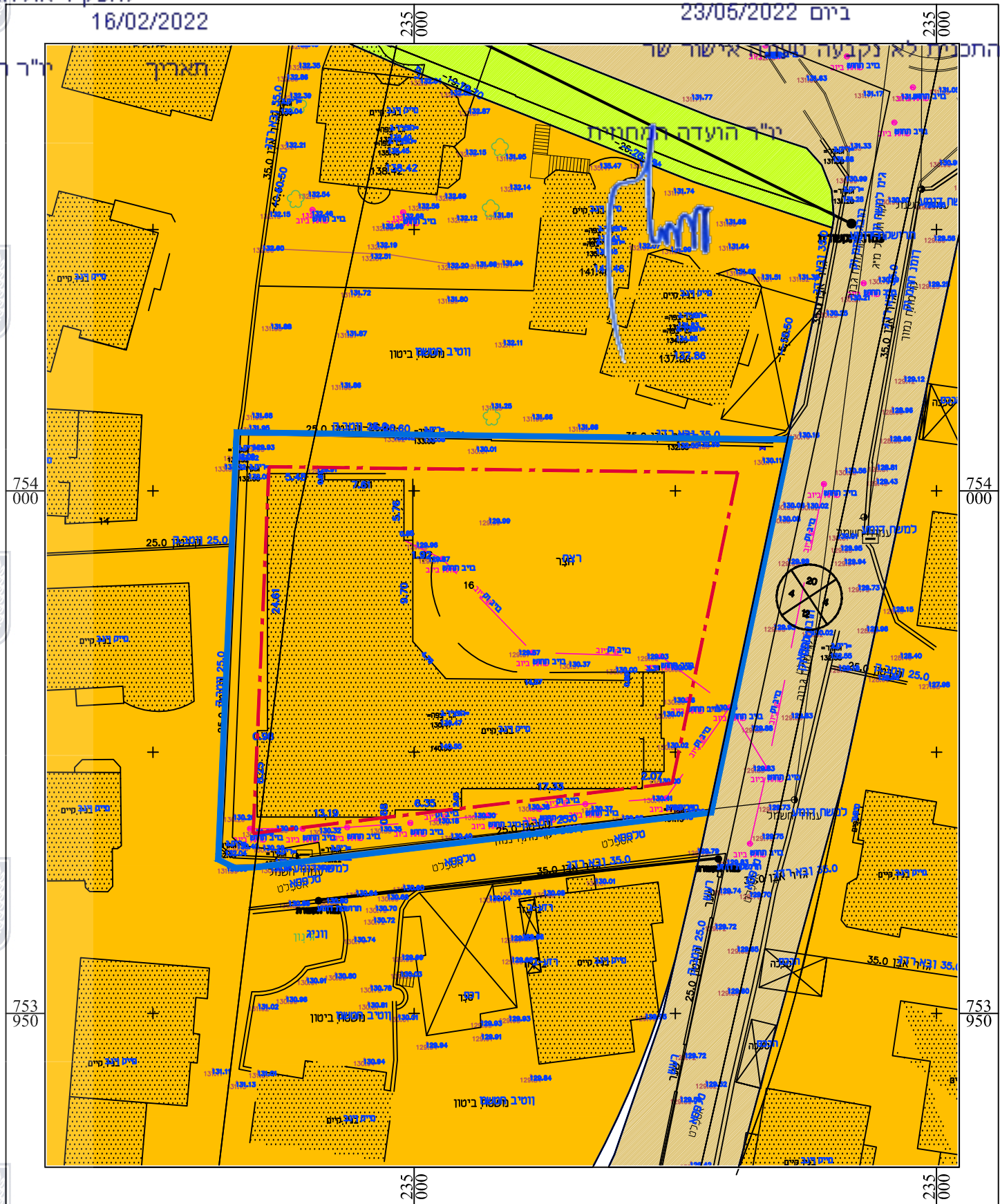
מצב מאושר : ע:9 תכנית גל"מ 850 קנ"מ - 1:500