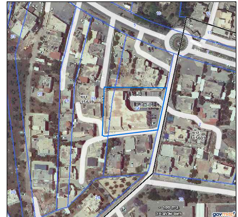
תרשים צילום אוויר משולב קנ"מ 1:2500

חוק התכנון והבניה, התשכ"ה - 1965 תכנית מפורטת