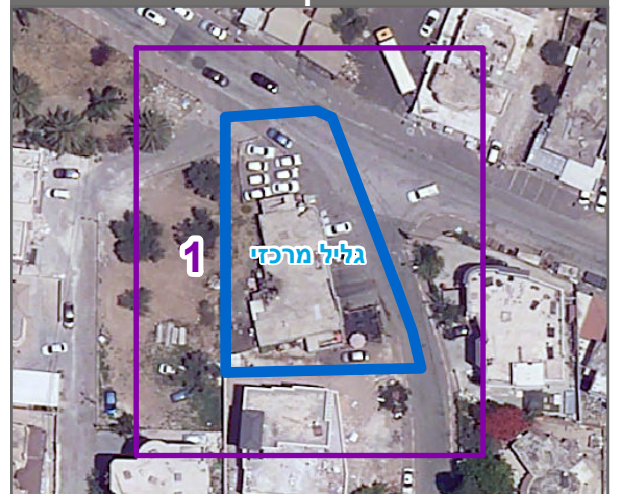
שנת צילום אוויר: 2019

הריני מצהיר בזאת כי המפה הטופוגרפית/המצבית המהווה רקע לתכנית זו, נערכה על ידי ביום 22.05.22 והיא הוכנה לפי הוראות נוהל מב"ת ובהתאם להוראות החוק ולתקנות המודדים שבתוקף. דיוק הקו הכחול והקדסטר: קו כחול (בלבד) ברמה אנליטית 1432 סמיר חטיב מספר רישון שם המודד תאריך חתימה