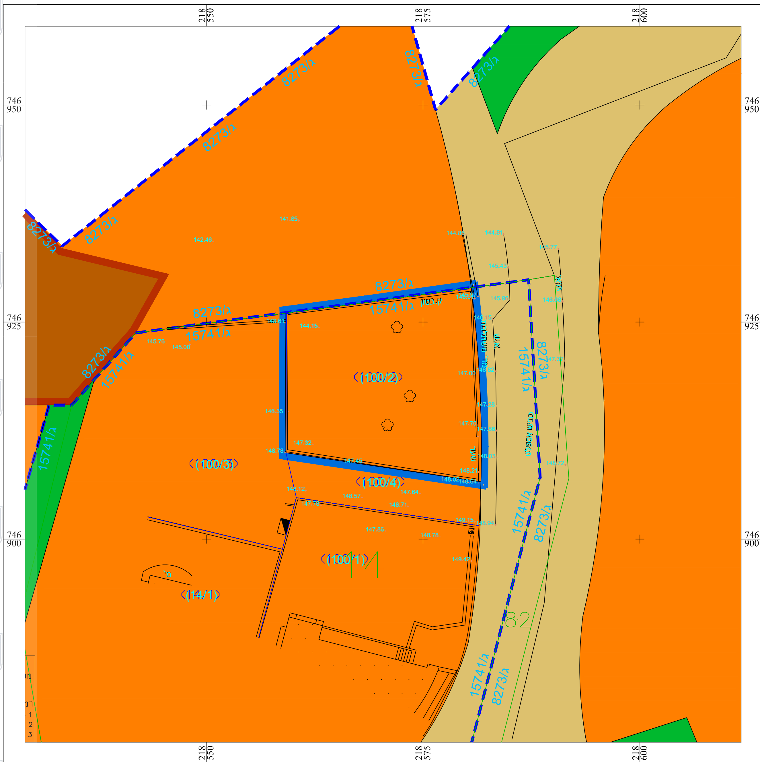
מצב מאושר קנ"מ 1 : 250