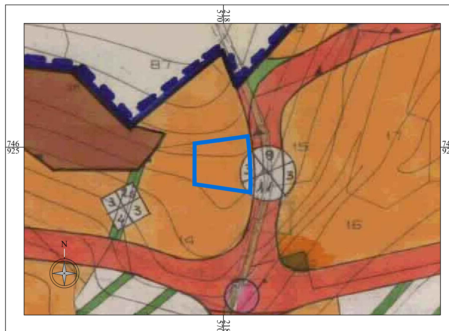
תרשים סביבה 8273/א קנ"מ 1 : 1000