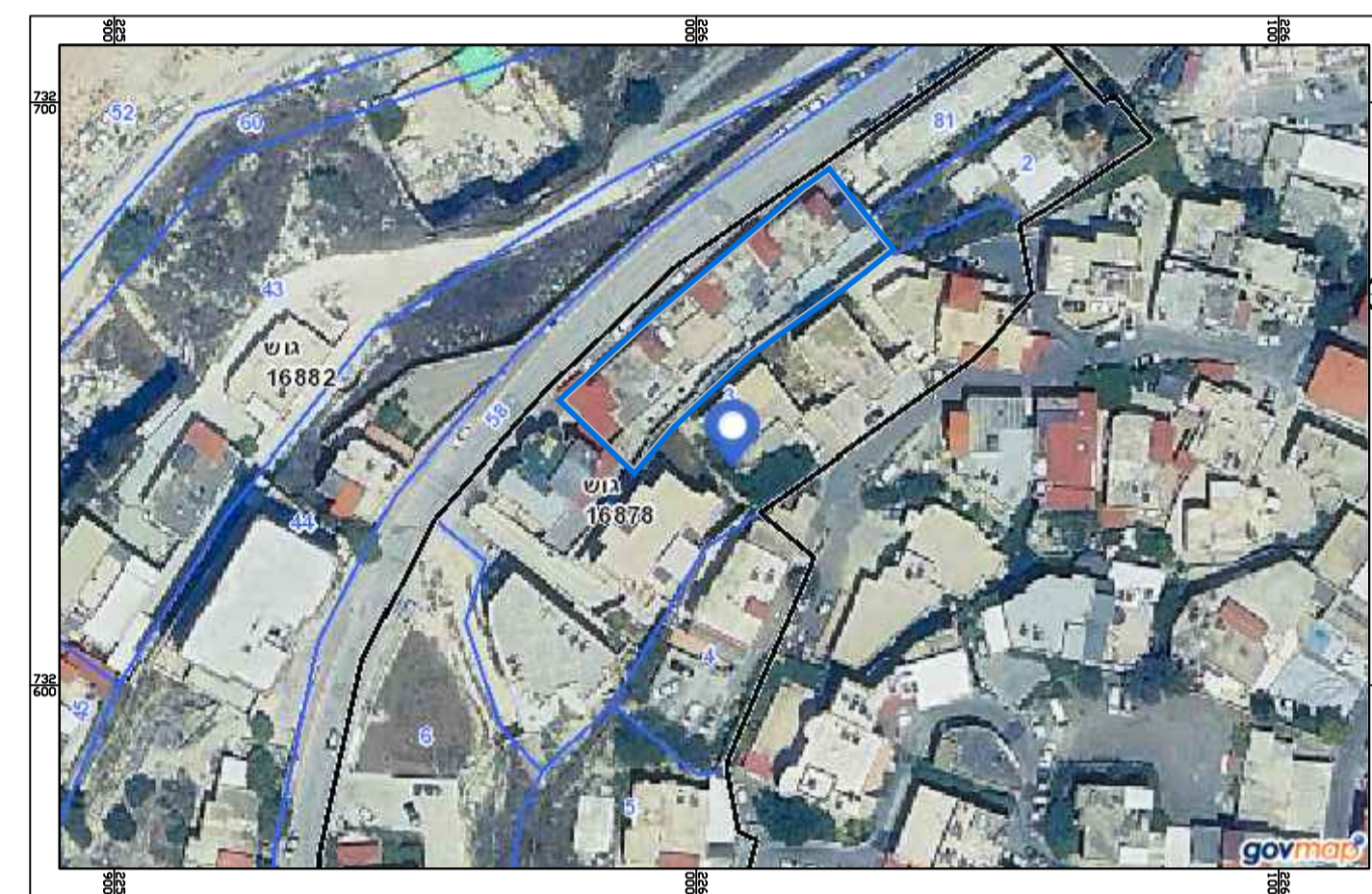
צילום אוויר קנ"מ 1:1250