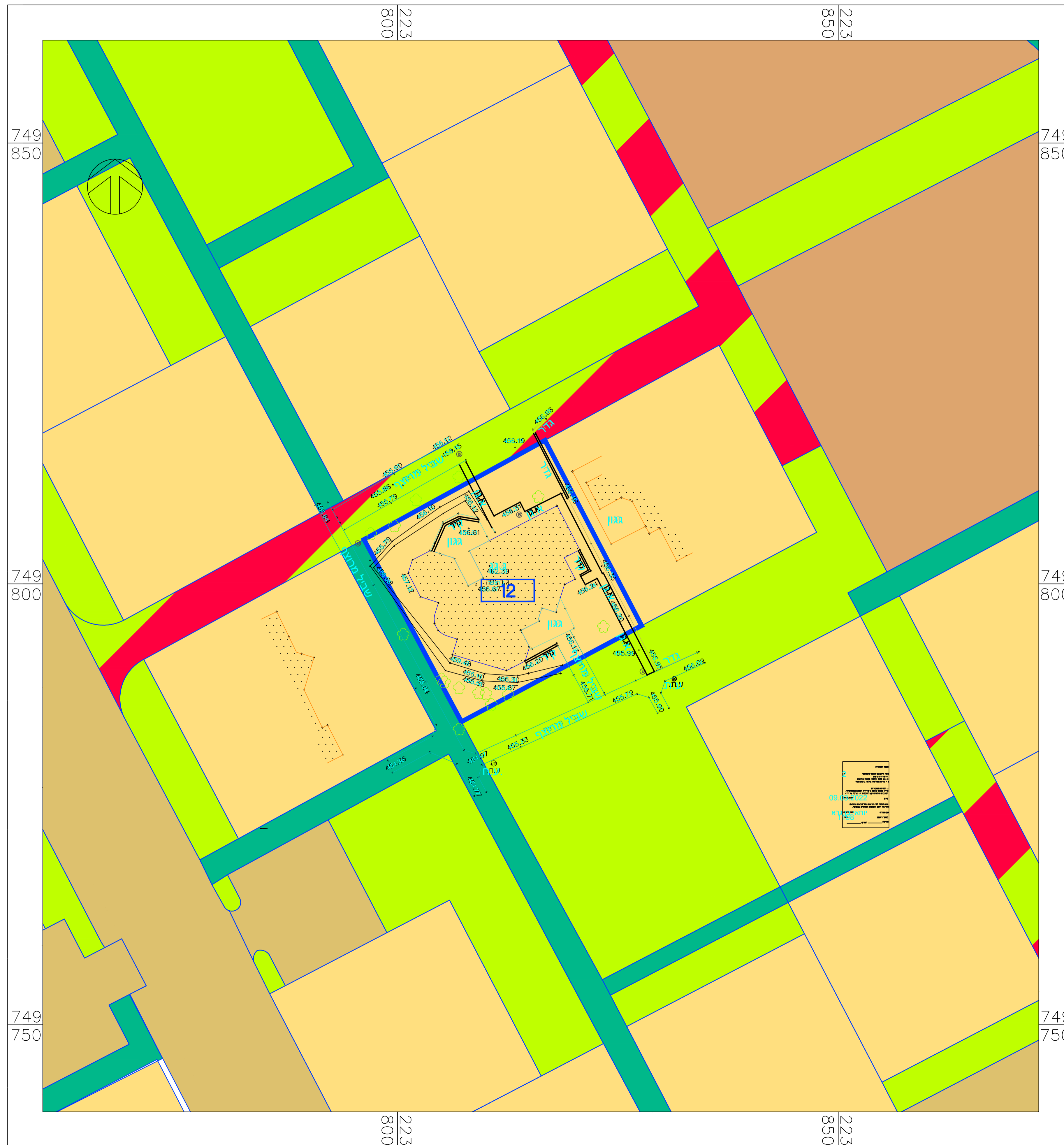
מצב מאושר 1:250

הנני מודיע כי יצאה תוכנית המסמלת את המצב המאושר והיא תקפה לתקופה של 18.3.2021 עד ליום 18.3.2022. כל שינוי או תיקון לתוכנית יבוצע על ידי המשרד המוסמך. תוכנית זו אינה מהווה אחריות על ידי המשרד המוסמך. כל שינוי או תיקון לתוכנית יבוצע על ידי המשרד המוסמך. תוכנית זו אינה מהווה אחריות על ידי המשרד המוסמך.