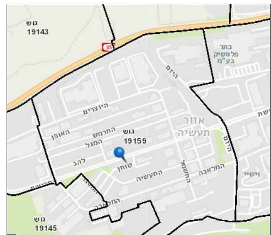
תכנית התמצאות כללית קנ"מ 1:100000