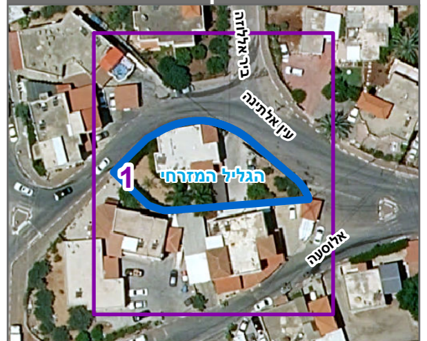
שנת צילום אוויר: 2019