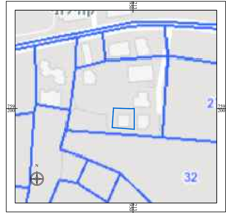
תרשים סביבה גושים וחלקות קנים 1 : 2500