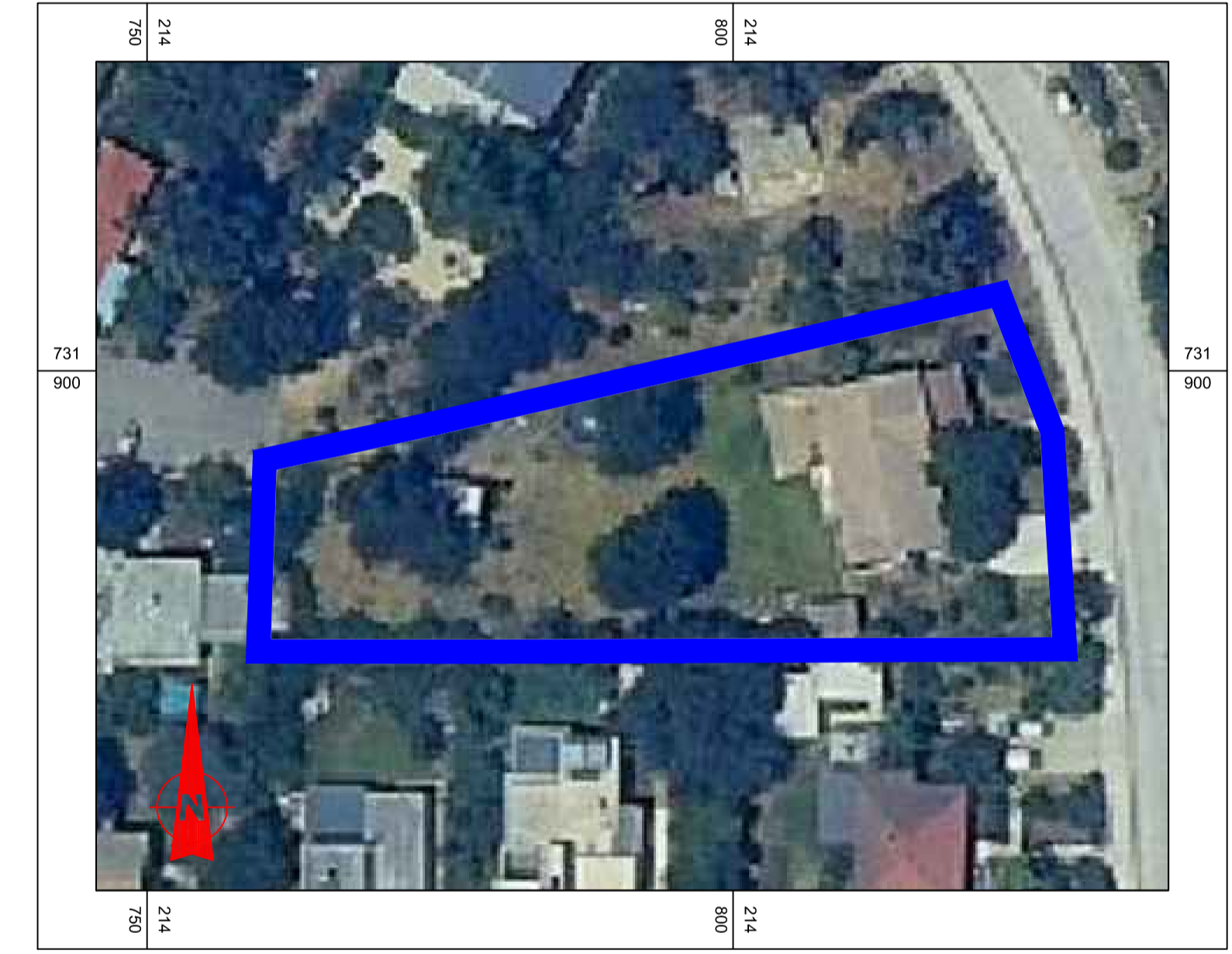
תרשים מתוך תצלום אוויר קנ"מ 1:500