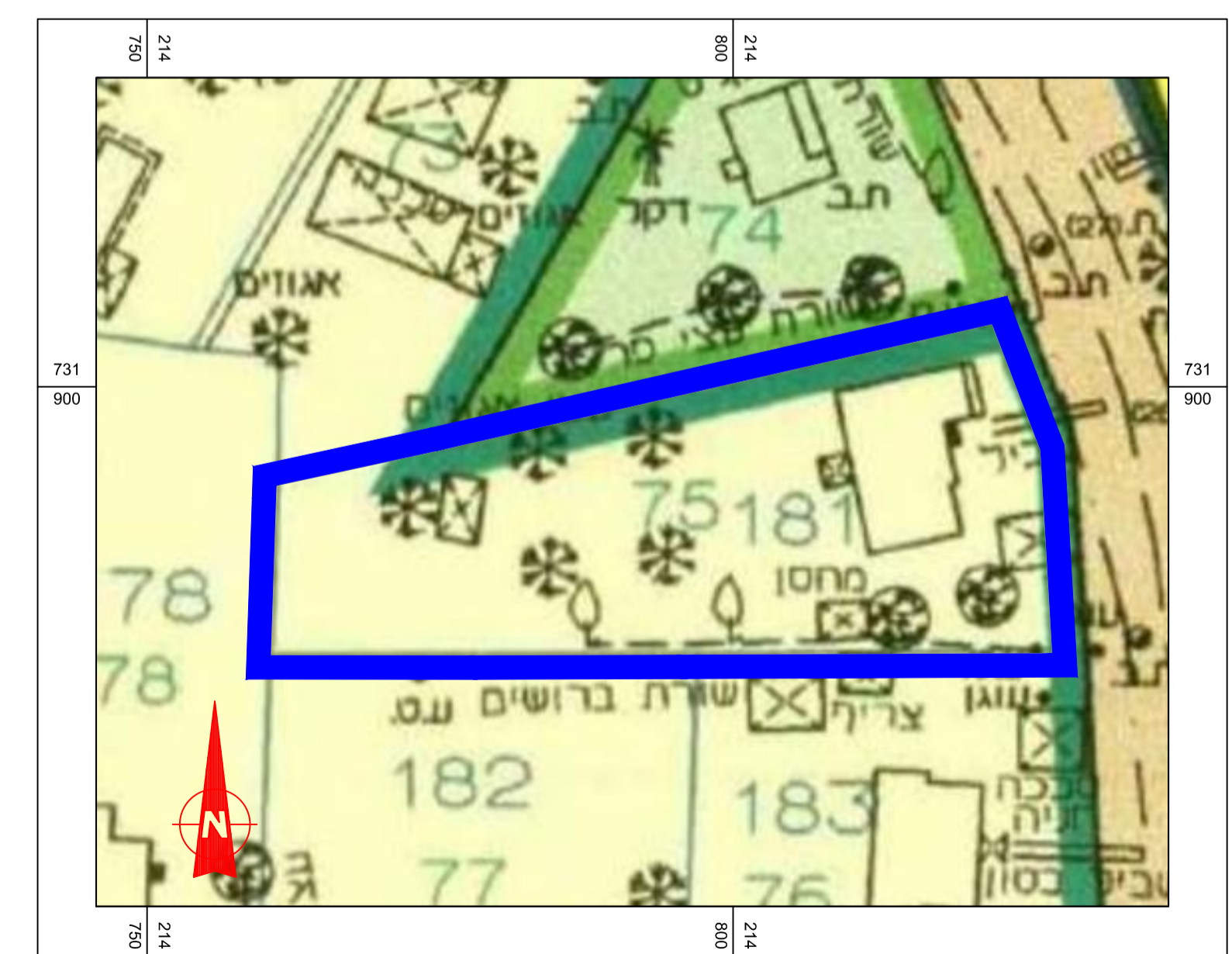
תרשים מתוך תכנית מאושרת ג'5473 קנ"מ 1:500