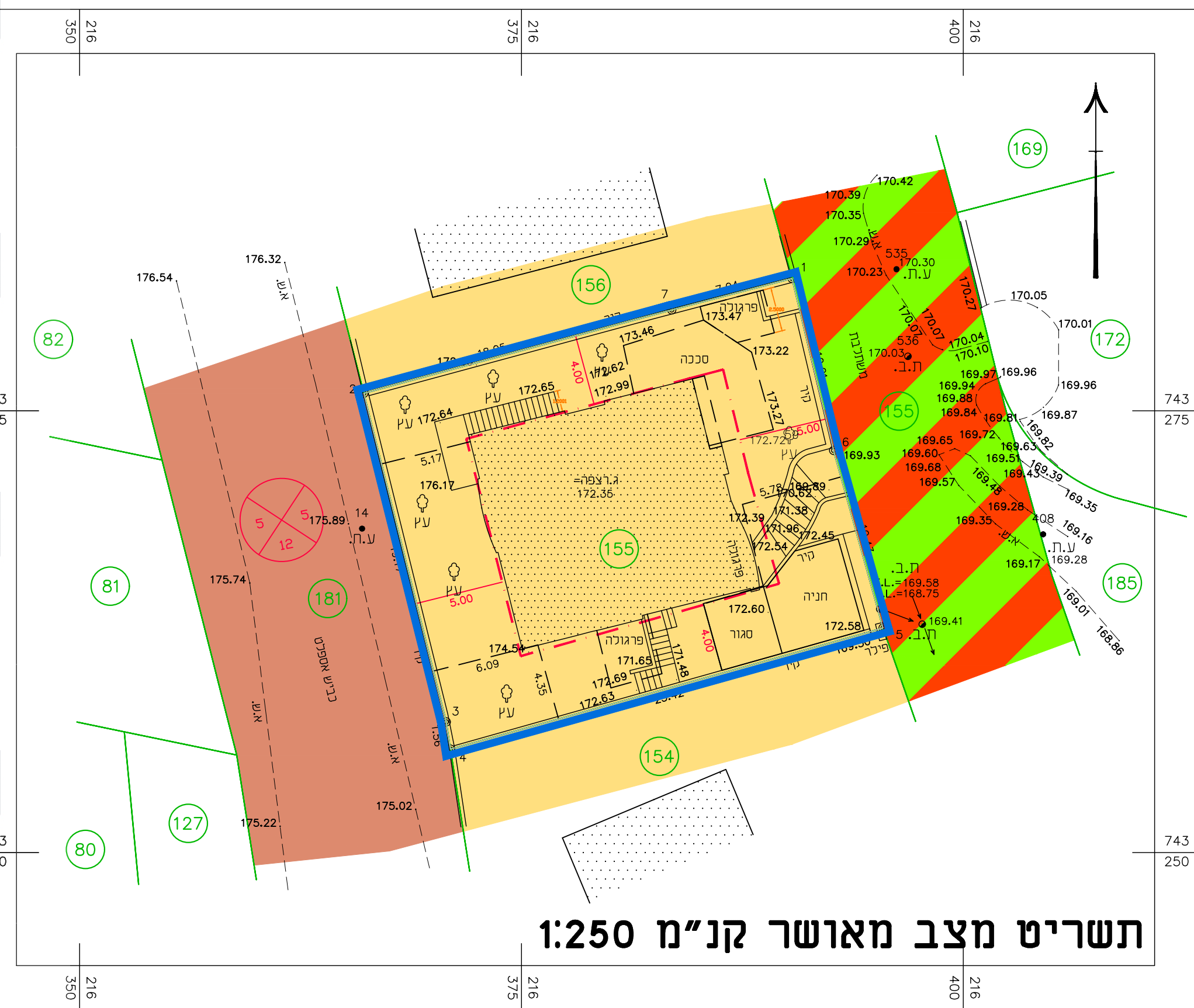
תשריט מצב מאושר קנ"מ 1:250