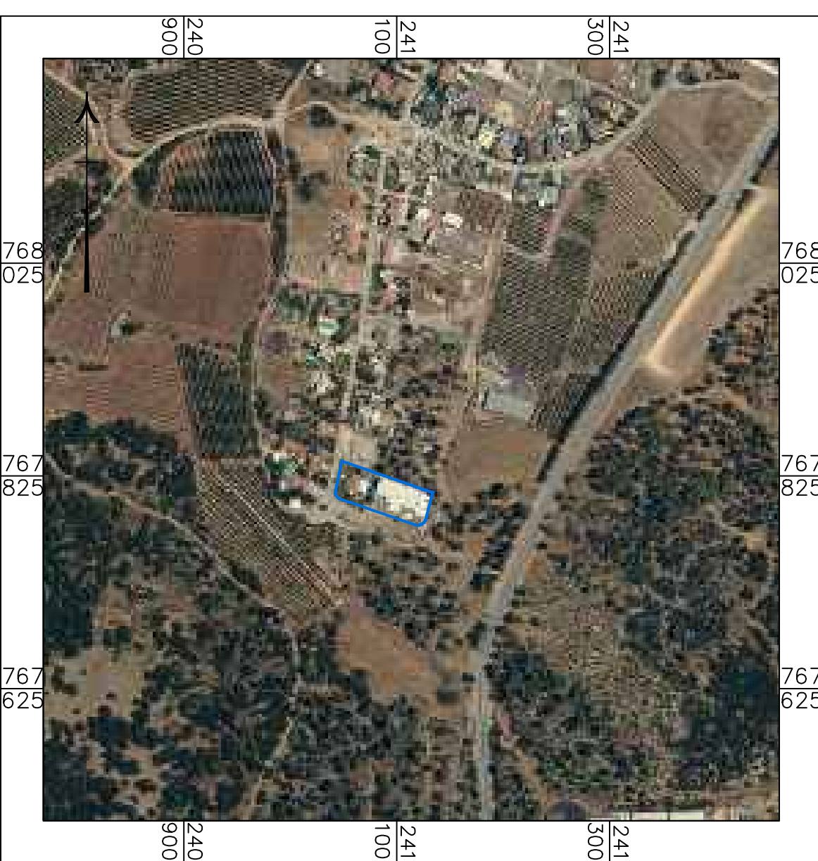
תרשים על רקע תצ"א קנ"מ 1:5000