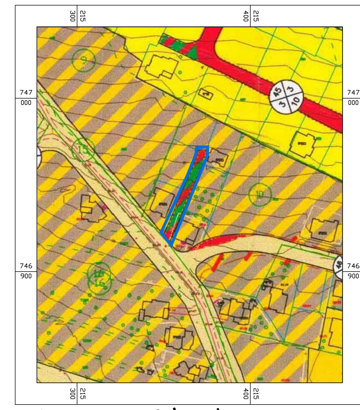
תרישים סביבה לפי ג'10567 קנ"מ 1:1250