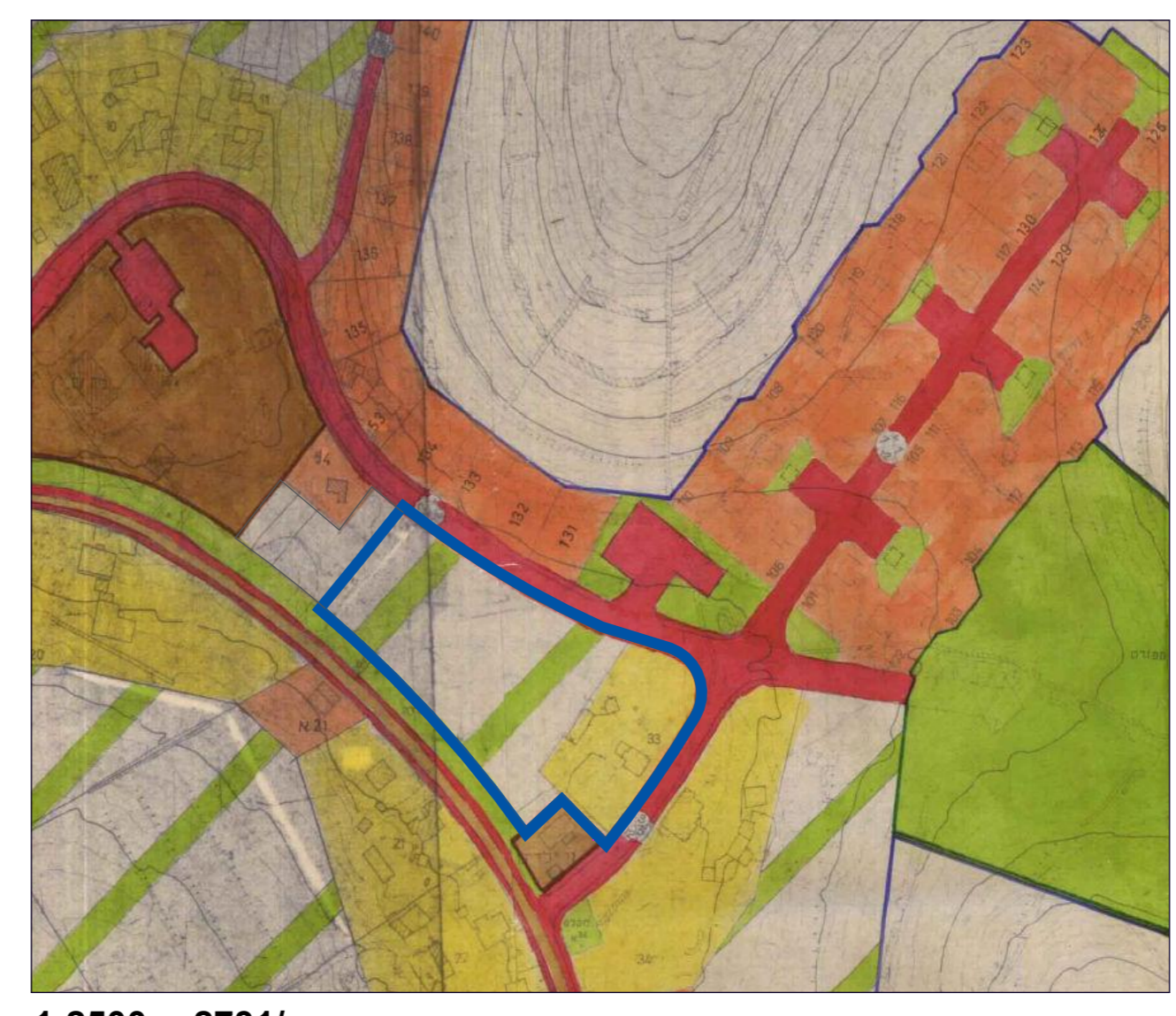
1:2500 תרשים סביבה מתוך ג/2731