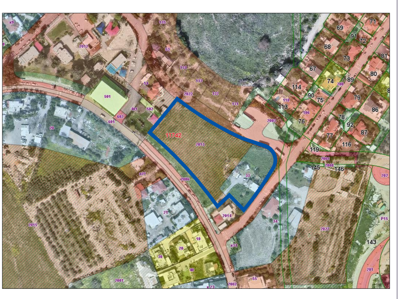
1:2500 תרשים מיקום: קומפליציה ע"ג תצלום אוויר