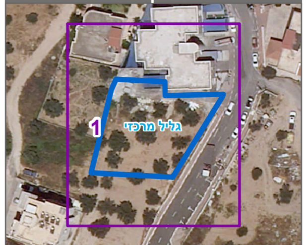
שנת צילום אוויר: 2019

הריני מצהיר בזאת כי המפה הטופוגרפית/המצבית המהווה רקע לתכנית זו, נערכה על ידי ביום 20.7.21 והיא הוכנה לפי הוראות נוהל מבא"ת ובהתאם להוראות החוק ולתקנות המודדים שבתוקף. דיוק הקו הכחול והקדסטר: מדידה אנליטית מלאה ברמת תצ"ר הנו אשרף 1145 שם המודד מספר רישון חתימה תאריך