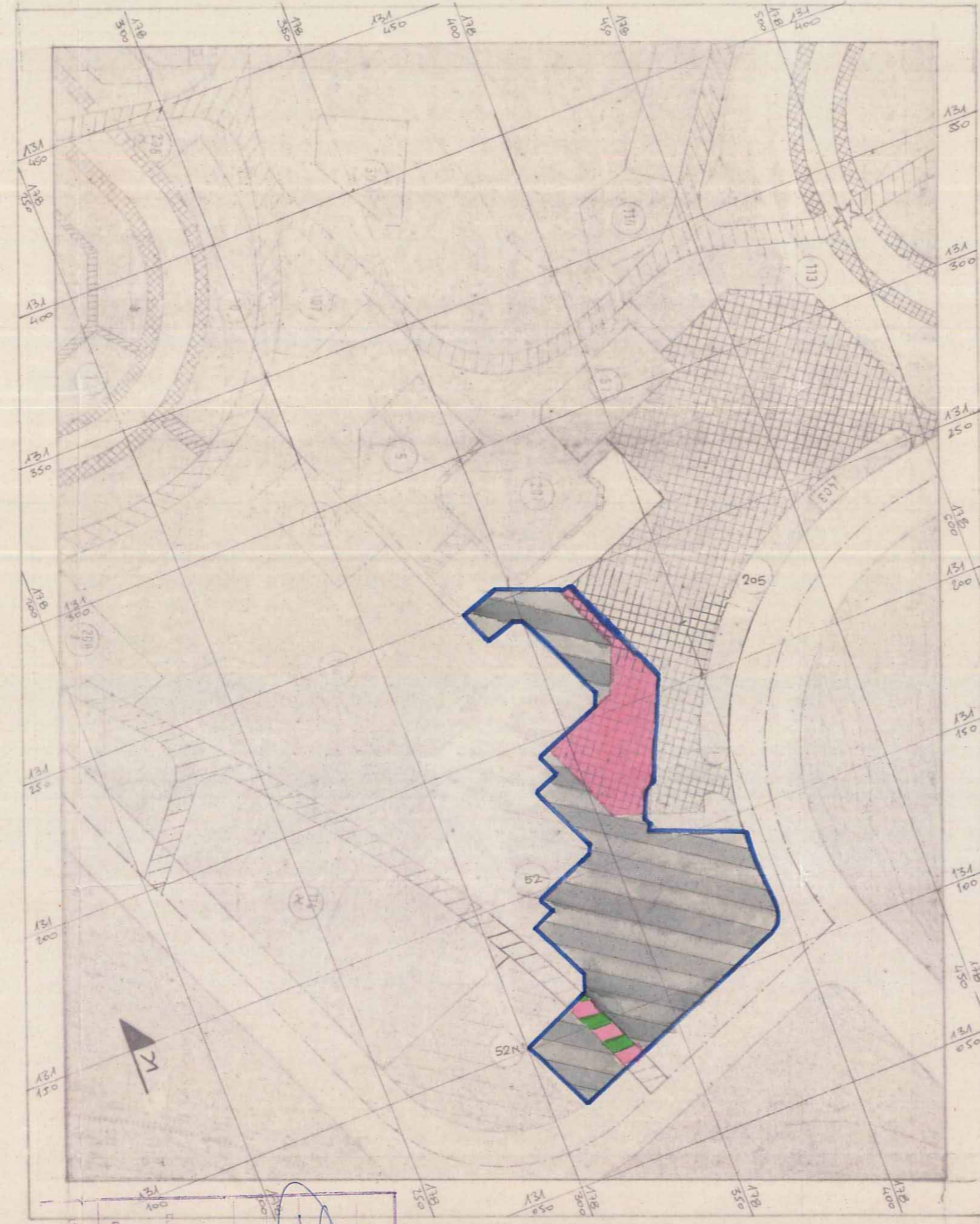
מצב קיים - ק.מ.: 1:1250