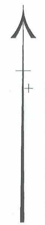
תרשים המקום קנה מידה 1 : 1250

מחוז : יהודה ושומרון נפה : בית לחם המקום : מעלה אדומים גוש : חלקה : 200 הוכן עבור בעלים השטח 478 מ"ר