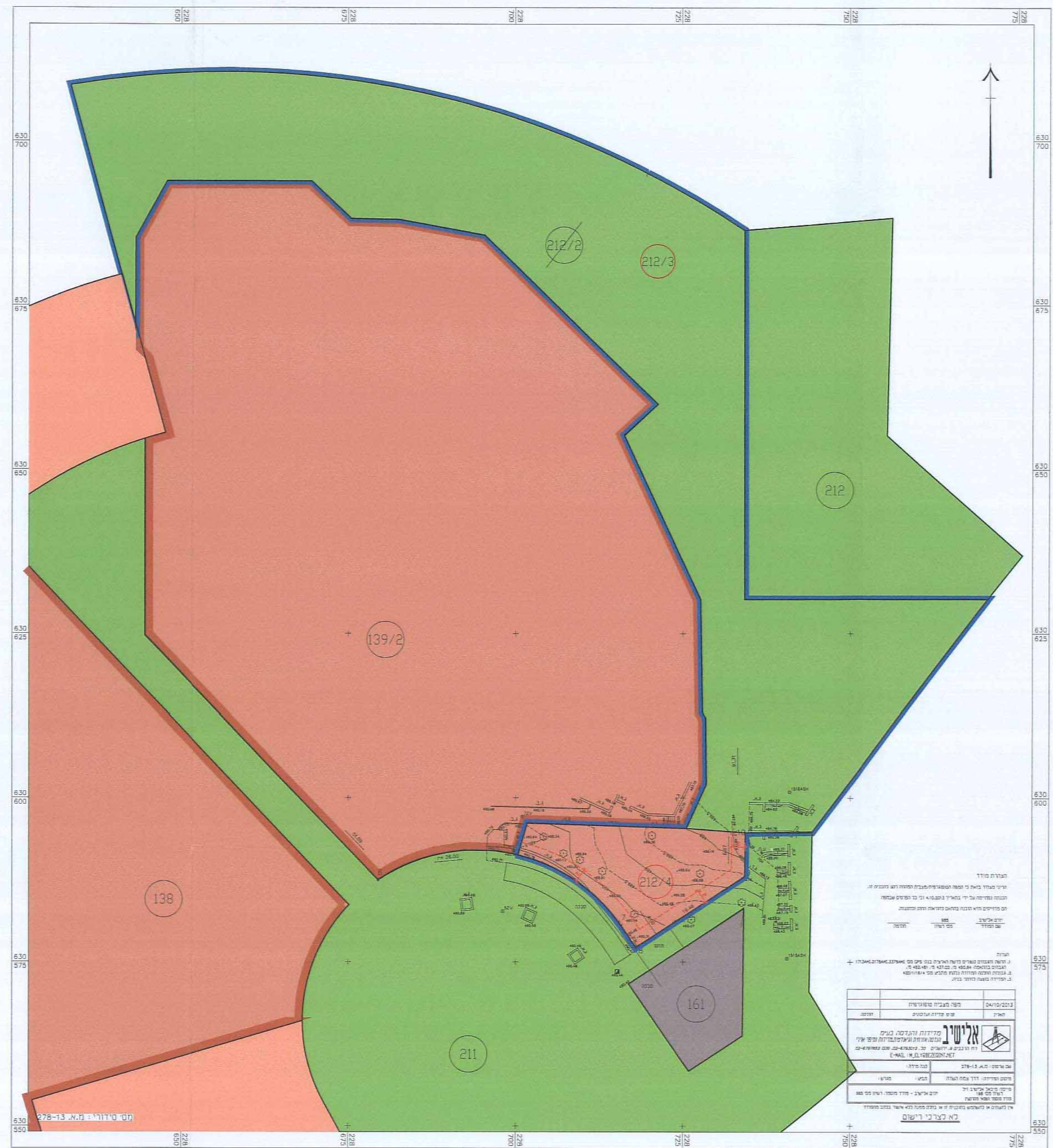
מצב מוצע ק"מ 1:500

אלשיב, מדידת, מיפוי אוריי, תחיה אורחוב ובגודרטית יום אלשיב, נודד מ"ר, 985 מהנדס אורחוב, MSc, ס"ר, 00101375