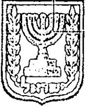
תכנון זמין מונה הרפסה 32

מימוש התכנית ייעשה בהתאם לשלבויות ביצוע ותקצוב מתאים כפי שיוחלט על ידי יזם התכנית, לפי שיקול דעתו על פי צרכי התחבורה המשתנים ואין ולא תהא זכות לחייב את יזם התכנית לבצע את התכנית בחלקה או במלואה שלא בהתאם לאמור לעיל. זמן לביצוע תכנית זו - 10 שנים מיום אישורה.