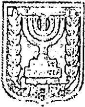
תכנון זמין מונה הרפסה 32