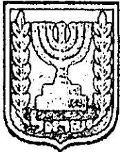
תכנון זמין מונה הרפסה 32