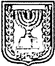
תכנון זמין מונה הדפסה 7