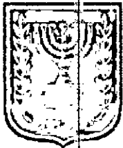
תוכנית זמין מונה הדפסה 7