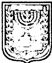
תכנון זמין מונה הדפסה