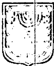
תוכנית זמין מונה הדפסה 7

דף ההסבר מהווה רקע לתכנית ואינו חלק ממסמכיה הסטטוטוריים.