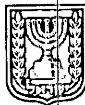
תכנון זמין מונה הדפסה 11

דף ההסבר מהווה רקע לתכנית ואינו חלק ממסמכיה הסטטוטוריים.