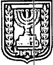
תכנון זמין מונה הדפסה 11

התוכנית מסדירה מיקום מתקנים הנדסיים תוך שינויים נקודתיים בקו בניין קדמי במגרש (תא שטח) מס' B251 6 ברח' הברזל, באר שבע. התכנית הינה בסמכות ועדה מקומית לפי סעיף 62א (א) (4) לחוק התכנון והבניה.