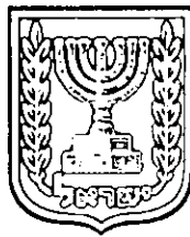
תכנון זמין מונה הדפסה 9