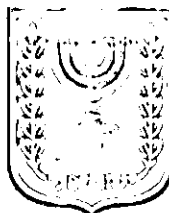
תכנון זמין מונה הדפסה 9

ינימורץ יוליוס מנהל תכנון עיריית נתיבות ירר הועדה 06/11/14