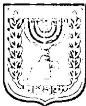
תכנון זמין מונה הדפסה 9