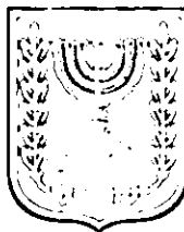
תכנון זמין מונה הדפסה 9

ועדה מקומית נתיבות אישור תוכנית מס' 609-0190843 הועדה המקומית החליטה לאשר את התוכנית בישיבה מס' 201405 ביום 06/11/14