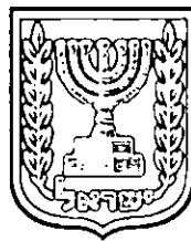
תכנון זמין מונה הדפסה 9