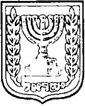
תכנון זמין מונה הדפסה 9

זמן משוער לביצוע התכנית- 5 שנים מיום אישורה.