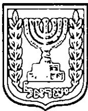
תכנון זמין מונה הדפסה 9