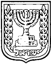
תכנון זמין מונה הדפסה 9