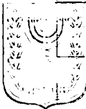
תכנון זמין מונה הדפסה 9

מחוז דרום מרחב תכנון מקומי נתיבות סוג תכנית תכנית מפורטת