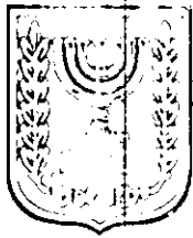
תכנון זמין מונה הדפסה 9