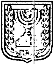
תוכן זמין מונה הדפסה 10