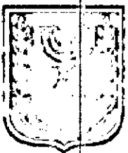
תוכן זמין מונה הדפסה 10

דף ההסבר מהווה רקע לתכנית ואינו חלק ממסמכי הסטטוטוריים.