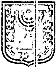
תוכן זמין מונה הדפסה 10

תכנית מטפלת במגרש 176/1 המיועד למגורים אי (חד משפחתי עם קיר משותף), הנמצא ברח' משנה 2, שכל דרום, באר שבע. תכנית המוצעת מאפשרת שינוי בקווי בניין.