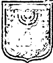
תכנון זמין מונה הדפסה 10

מגורים במגרש 176/1, רח' מנשה 2, שכ' דרום, באר שבע