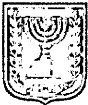
תכנון זמין מונה הדפסה 15

ועדת התכנון המוסמכת להפקיד את התכנית מקומית