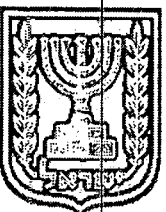
תכנון זמין מונה הדפסה 13

דף ההסבר מהווה רקע לתכנית ואינו חלק ממסמכיה הסטטוטוריים.