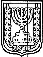
תכנון זמין מונה הדפסה 11

תכנית זו עוסקת בשינוי קו בניין במגרש 909, בפינת הרחובות ציזלינג ויערי מאיר, בבאר שבע. שינוי קו הבניין יאפשר את הרחבת בית הכנסת הקיים על המגרש. כמו כן, התכנית קובעת מבנים להריסה שנבנו ללא היתר.