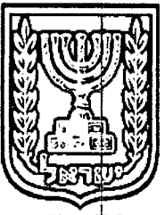
תכנון זמין מונה הדפסה 11

דף ההסבר מהווה רקע לתכנית ואינו חלק ממסמכי הסטטוטוריים.