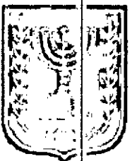
ת.א. זמין מונה: 32

דף ההסבר מהווה רקע לתכנית ואינו חלק ממסמכיה הסטטוטוריים.