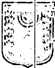
ת.א. זמין מונה: 32

דף ההסבר מהווה רקע לתוכנית ואינו חלק ממסמכיה הסטטוטוריים.