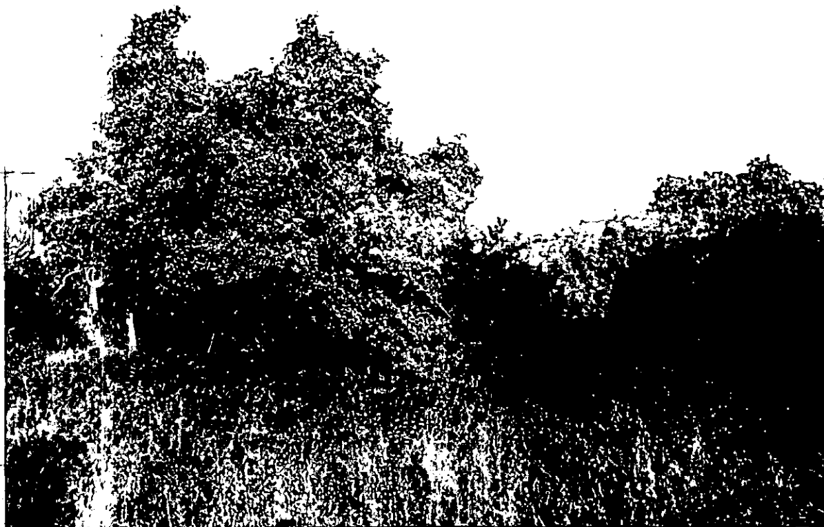
תמונה 3: אלון מספר 311