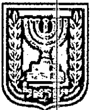
תכנון זמין מונה הדפסה 12

דף ההסבר מהווה רקע לתכנית ואינו חלק ממסמכיה הסטטוטוריים.