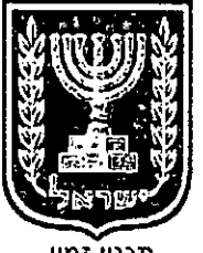
תכנון זמין מונה הדפסה 12