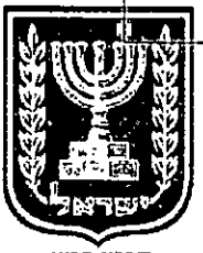
תכנון זמין מונה הדפסה 12