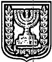
תכנון זמין מונה הדפסה 18