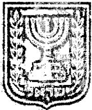
תכנון זמין מונה הדפסה 10