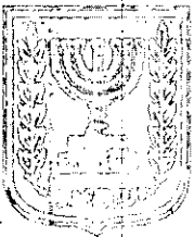
הכונן זמין מונה הדפסה 10

דף ההסבר מהווה רקע לתכנית ואינו חלק ממסמכי הסטטוטוריים.