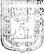
הכונן זמין מונה הדפסה 10

התכנית באה להסדיר שטח אשר מטופח כגינה קהילתית על ידי תושבי שכונת מחנה ישראל ונמצא בחלקו על ייעוד מגורים על ידי שינוי הייעוד בחלקה כולה לשצ"פ. התכנית מקודמת ביוזמת עיריית ירושלים בעקבות פניות תושבי השכונה על מנת לשמור את הגינה הקהילתית בשכונה שמהווה מקום מפגש יחיד לתושבי השכונה. מרבית השטח כיום ביעוד מגורים ובעלות מנהל מקרעי ישראל