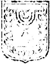
תכנון זמין מונה הדפסה 10

האם כוללת הוראות לענין תכנון תלת מימדי לא