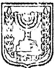
תכנון זמין מונה הדפסה 10