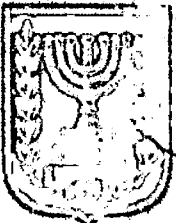
תכנון זמין מונה הדפסה 10