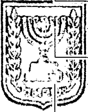
תכנון זמין מונה הדפסה 10