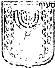
תכנון זמין מונה הדפסה 10