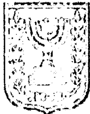
תכנון זמין מונה הדפסה 10