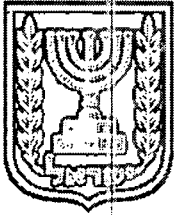
תכנון זמין מונה הדפסה 7

שם התכנית: בניה למגורים ברח' בטן אל הווא, שכל סילוואן. תיאור התכנית: מגרש בגודל 515 מ"ר בשכ' סילוואן אזור בטן אל הווא, בשטח המיועד למגורים 6 מיוחד ושטח ציבורי פתוח לפי תכנית מס' 2783א המאושרת. מטרת התכנית היא שינוי יעוד השטח למגורים ביוֹרֶךְ לשם הקמת בנין בן 4 קומות ויצירת 8 יח"ד. המגרש הוא ריק ממבנים. מגיש התכנית הוא בעל עניין בקרקע.