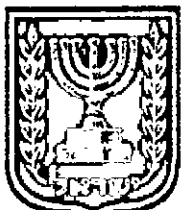
תכנון זמין מונה הדפסה 27