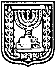
תכנון זמין מונה הדפסה 27