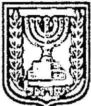
תכנון זמין מונה הדפסה 27