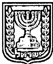
תכנון זמין מונה הדפסה 27