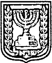
תכנון זמין מונה הדפסה 27

האם כוללת הוראות לענין תכנון תלת מימדי לא