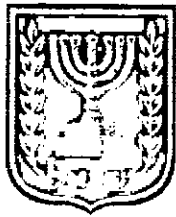
תכנון זמין מונה הדפסה 6

האם כוללת הוראות לא לענין תכנון תלת מימדי