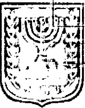
תכנון ומיזם מונה הדפוס