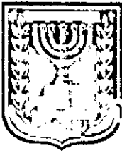
תכנון ומיזם מנהל הדפוס

1.5.2 תיאור מקום המגרש ממוקם בשוליים המערביים של שכונת אבני חן בין רחובות אבני החושן ויהודה מכבי.