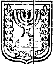
תכנון זמין מונה הדפסה 6