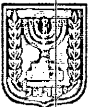
תכנון זמין מונה הדפסה 6

דף ההסבר מהווה רקע לתכנית ואינו חלק ממסמכיה הסטטוטוריים.