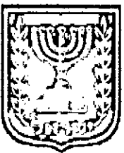
תכנון זמין מונה הדפסה 6